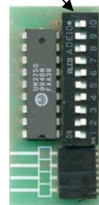
MODULO SV-MX7 CODIFICA